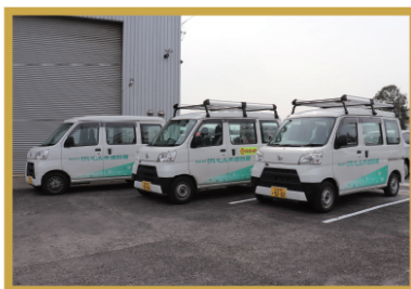
サービスカーが皆さまのところへお伺いします

今回は、現場担当もお客様と接する機会が増えてきていることもあり、挨拶や言葉遣い・電話応対などの基本的なビジネスマナーのスキルアップを目的に研修にご参加いただきました。