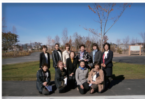
女性会視察研修会