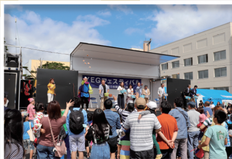
青年部 YEG フェスティバル